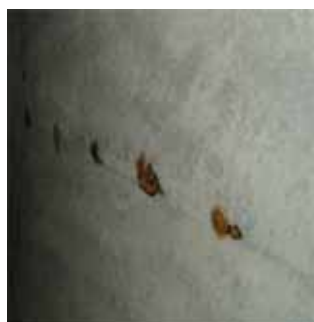
写真-3 旧高負荷ばっ気槽躯体劣化状況

体の劣化に関しては、硫化水素の影響もあり、ある程度の劣化の確認もされていた。この対策としては、超高压水による石膏化部分及びFe層を除去し、断面修復後に防食被覆する予定であった。しかし、生物処理棟の流入調整槽、酵母反応槽、ばっ気槽（旧高負荷ばっ気槽）において、汚水、汚泥引抜後の洗浄後の槽内で、乾燥した後の確認をした結果、壁面のところどころに錆のしみ出しが発見された。（下記写真参照）