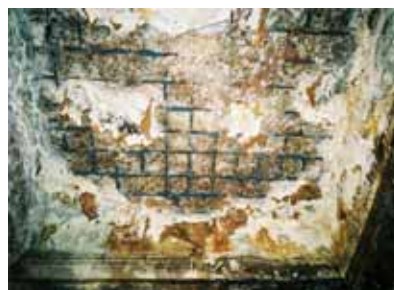
写真-4 第三流量調整槽躯体劣化状況

水槽天井部分のコンクリート表面が完全に剥落しており、鉄筋がむき出しになるとともに、その大半が断面の欠損が著しい腐食を呈していた。（下記写真参照）