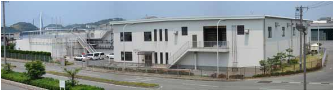
写真-2 終末処理施設全景