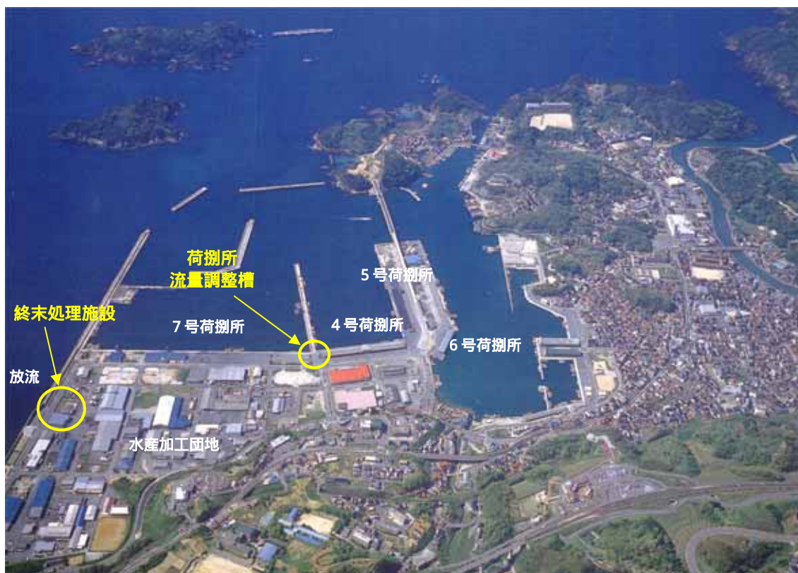
写真-1 浜田漁港海域全景

当センターにおいて、この事業に関する積算、現場施工管理業務を島根県から受託し行った内容について以下に説明する。