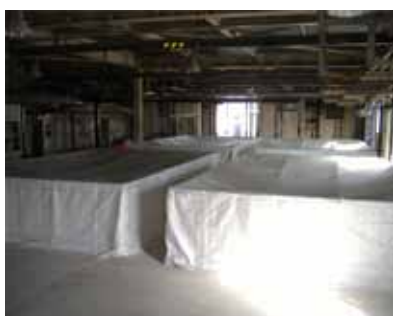
写真-5 安全手摺及び防臭シート

このことから、流入調整槽からオーバーフローした汚水の貯留方法を変更して、第三流量調整槽の設備規模を必要最小限にした。また、スラブ撤去後の対応として、安全手摺や防臭シート（下記写真参照）を施工し、安全の確保とともに、できる限りのコストの削減にも努めた。